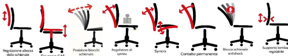
le immagini sono rappresentative dei movimenti delle sedute

Meccanismi Elevazione a gas; - Schienale regolabile up-down ; - Meccanismo synchro tra sedile e schienale, a contatto permanente schienale con ritorno controllato da con 4 blocchi antishock; -